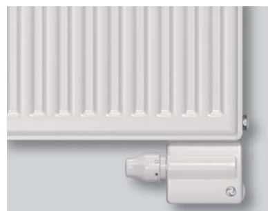
TWINTEC in Kombination mit Flachheizkörpern