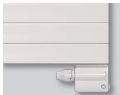
TWINTEC in Kombination mit Konvektoren und Heizwänden