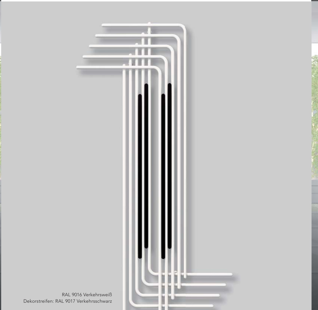
RAL 9016 Verkehrsweiß Dekorstreifen: RAL 9017 Verkehrsschwarz