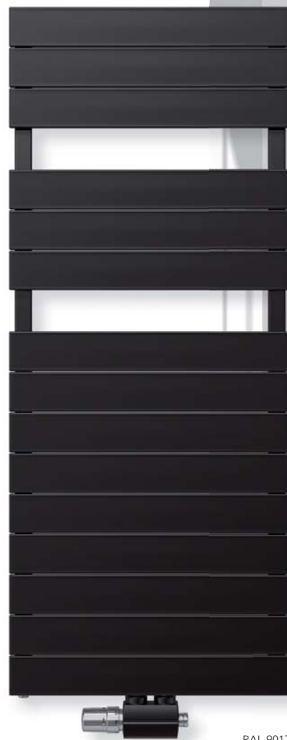
Möbel MONDO & TEAM 7

Ihr Vorteil: Praktische Wäschetrocknerfunktion gepaart mit hoher Heizleistung machen dieses Modell zum multifunktionalen Wärmemöbel.