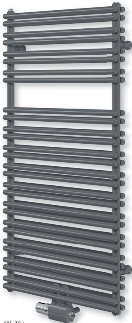
RAL 7015 Schiefergrau