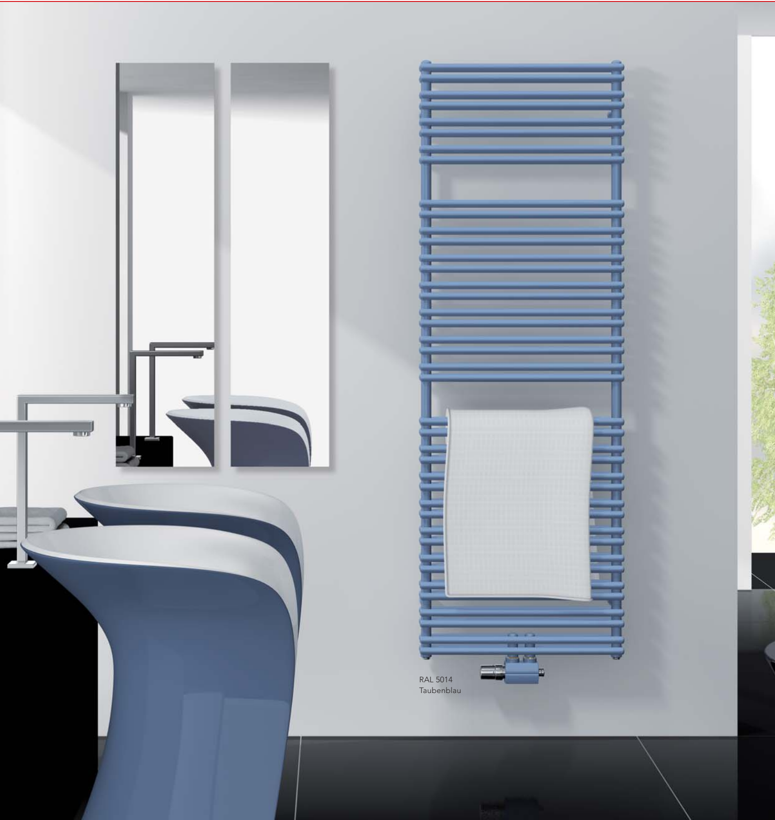
RAL 5014 Taubenblau